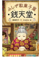
廣嶋玲子・作 iyajya・絵 偕成社刊